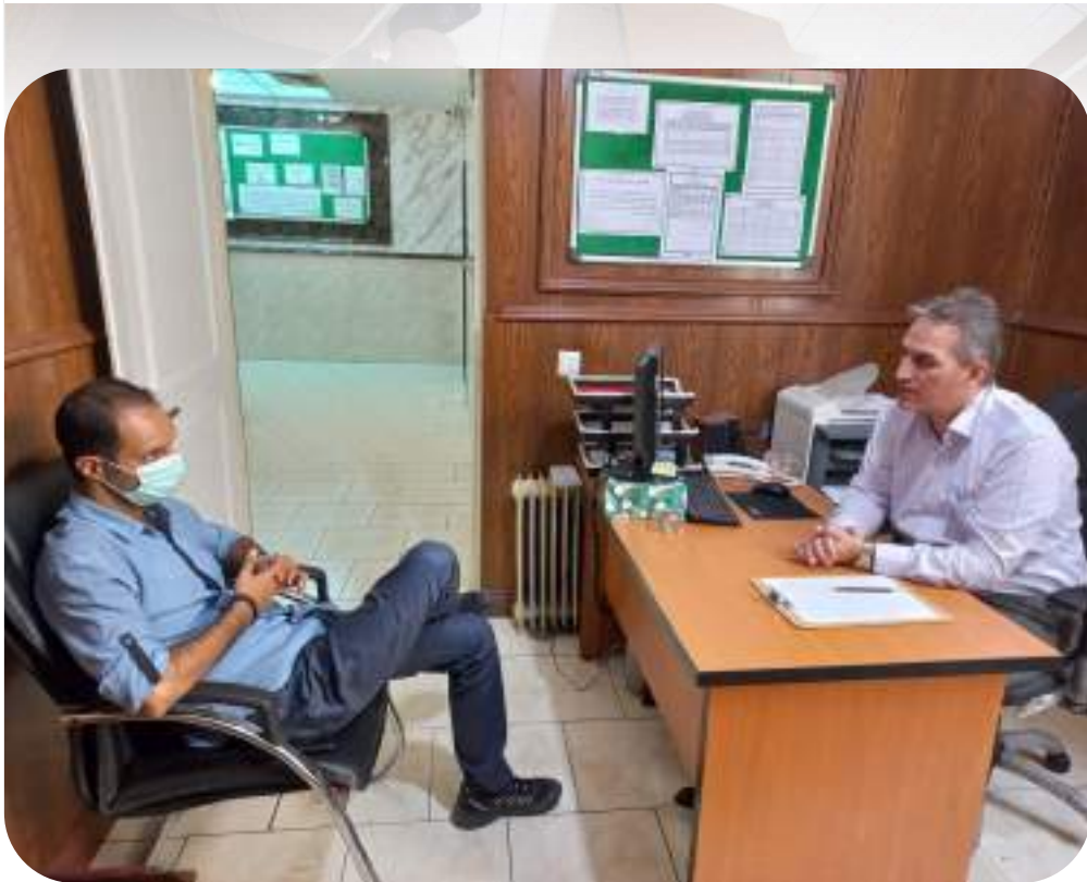
شکل ۱۶- برگزاری جلسات پیرامون مسائل آموزشی با دبیران