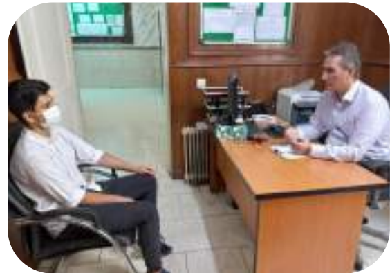
شکل ۱۰- مشاوره فردی با دانش آموزان