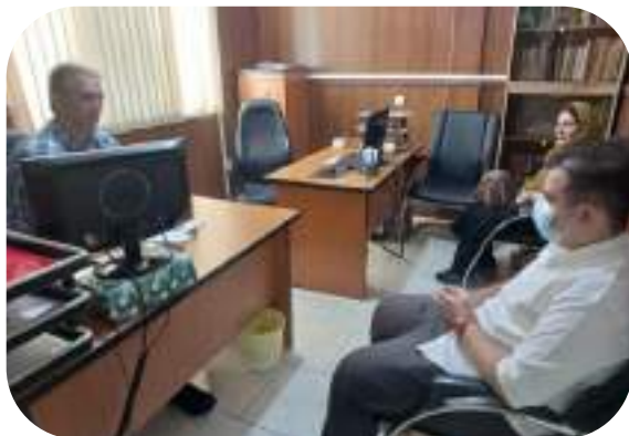
شکل ۱۲- مشاور فردی با اولیا و دانش آموزان