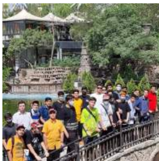
شکل ۳- اردوی بازدید از باغ پرندگان