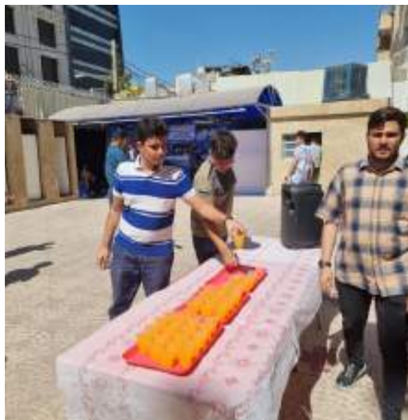
شکل ۱- برگزاری مراسم عید غدیر