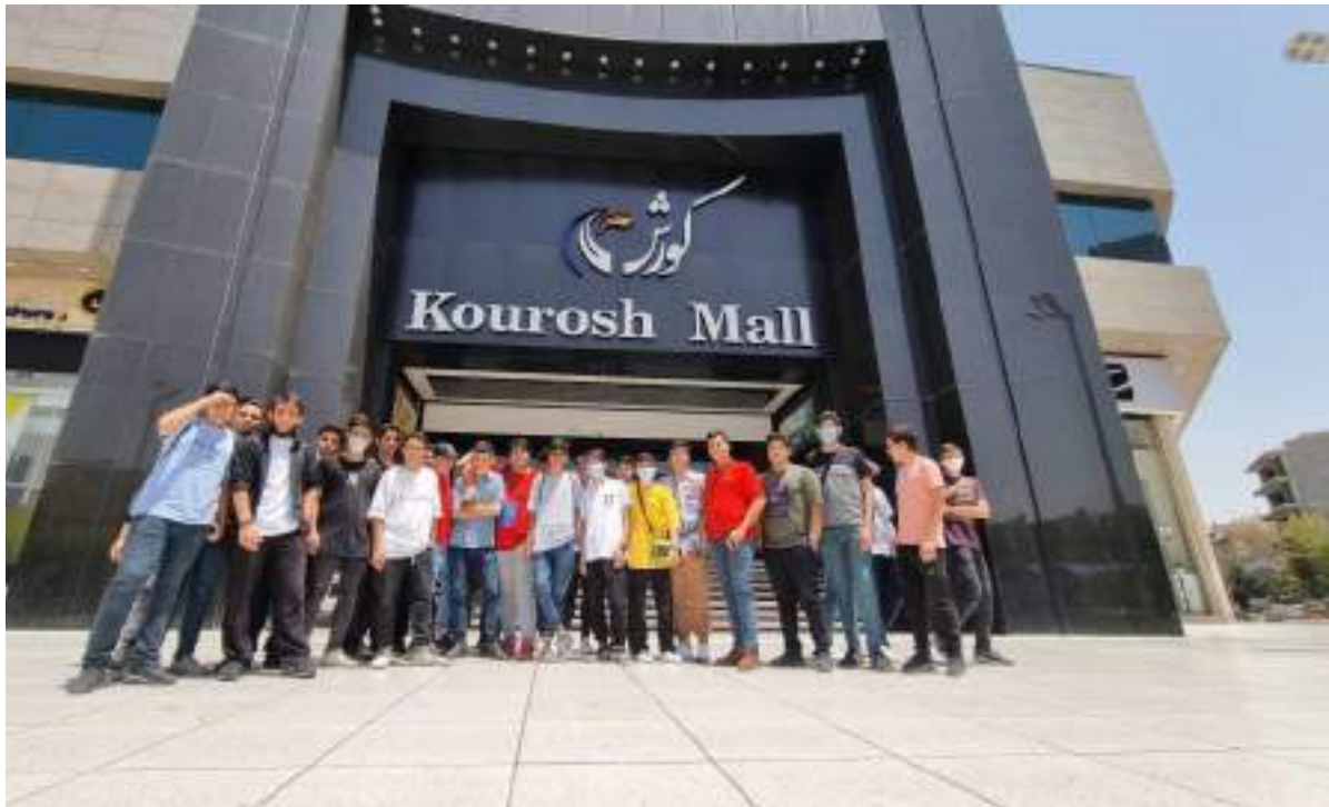
شکل ۶- اردوی پردیس سینمایی کوروش