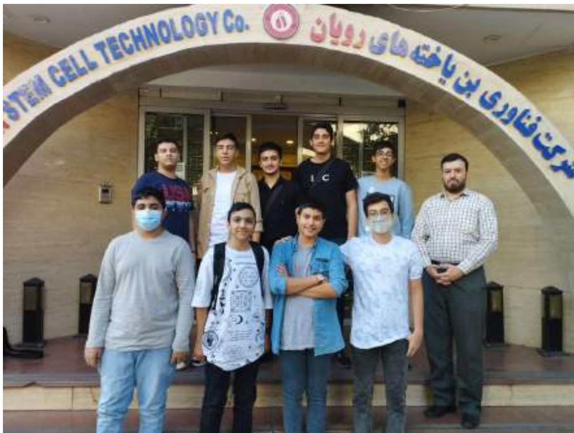
شکل ۷- اردوی پژوهشگاه رویان