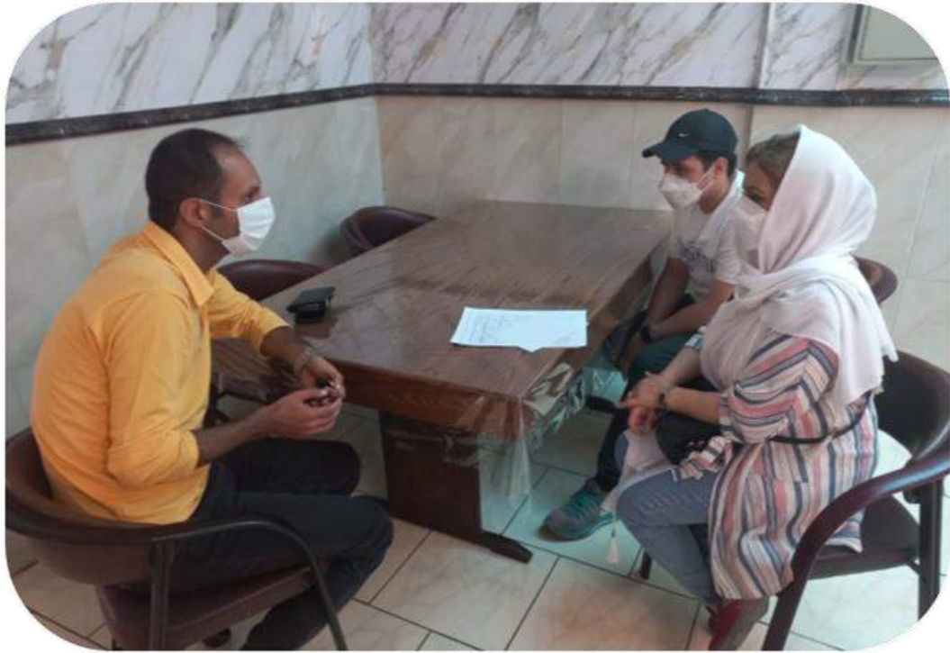
شکل ۱۳- دیدار اولیا و دبیران