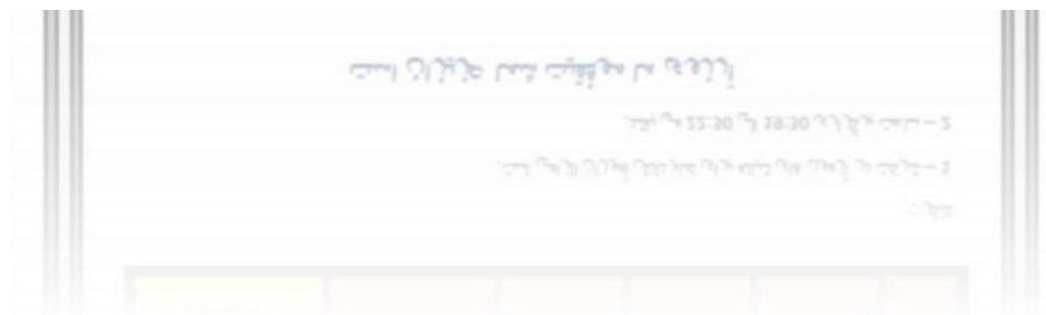
شکل ۲۰- برگزاری بیش از ۲۰ آزمون شبانه