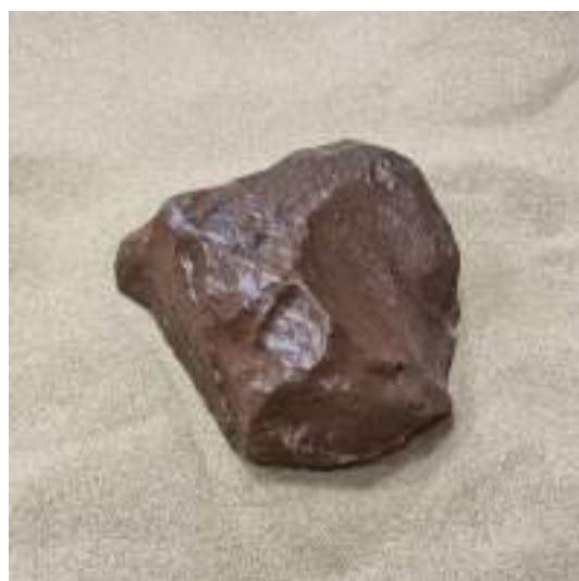
- اردوی بازدید از برج آزادی و موزه شهاب سنگ 5 شکل