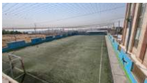
شکل ۲- بازدید از زمین‌های ورزشی