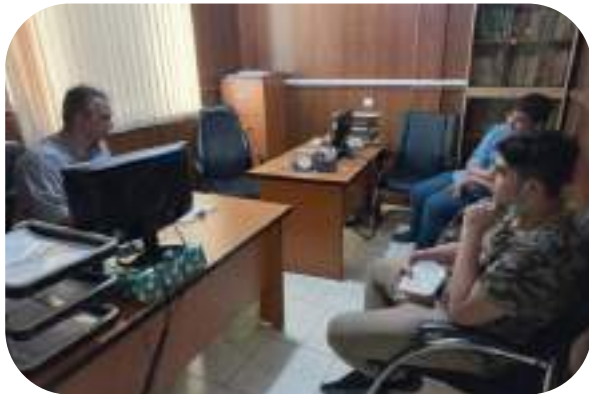
شکل ۹- مشاوره گروهی با دانش آموزان