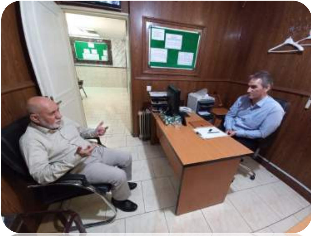
شکل ۱۵- برگزاری جلسات متعدد با مدیریت دبیرستان