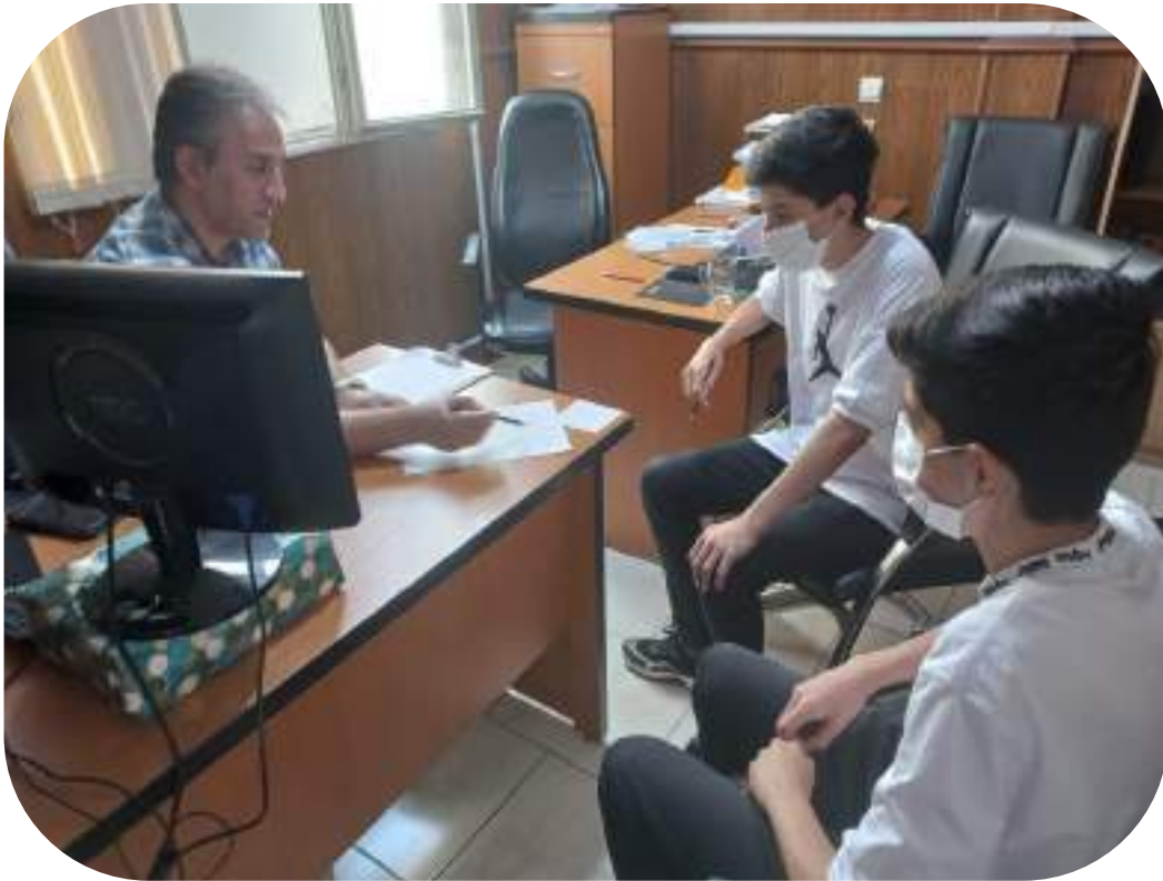
شکل ۱۸- شخصی سازی برنامه مطالعاتی