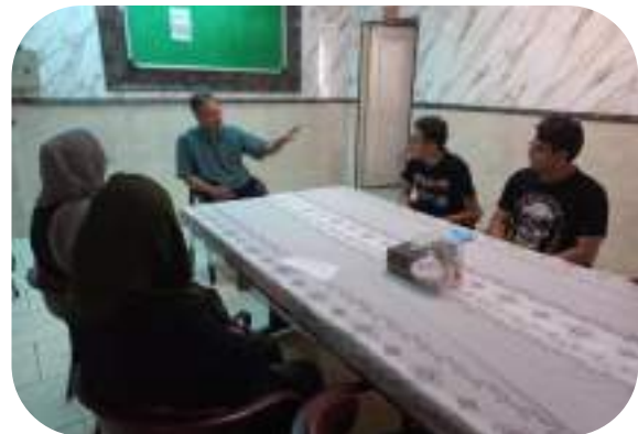
شکل ۱۱- مشاوره گروهی با اولیا و دانش آموزان