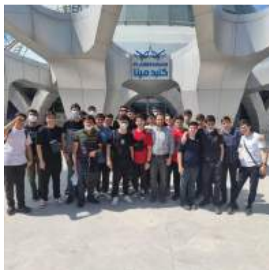
شکل ۴- اردوی بازدید از گنبد مینا