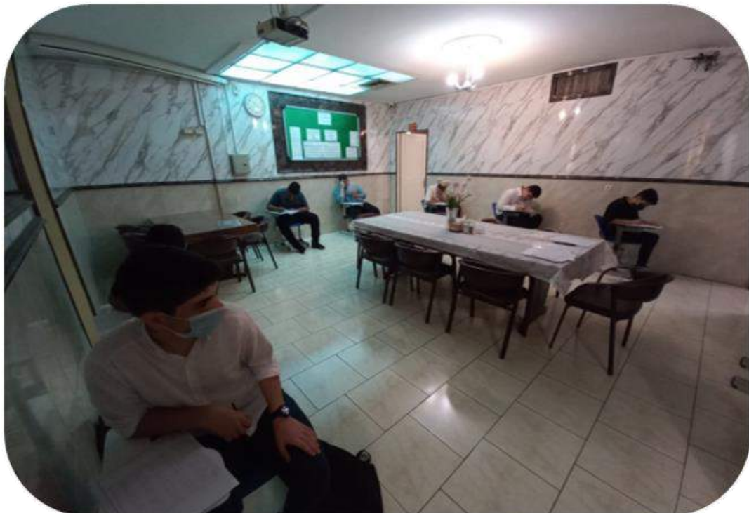
شکل ۱۴- برگزاری ۳ آزمون جامع